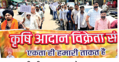
हरिभूमि न्यूज | अशोकनगर

कृषि आदान विक्रेता संघ ने व्यापारियों की समस्याओं के निराकरण की मांग को लेकर एक ज्ञापन सौंपा है, जिसमें कहा गया है कि यह संगठन 5 लाख व्यापारियों से जुड़ा है, व्यापारी पिछले 10 वर्षों से कई समस्याओं का सामना कर रहे हैं। जिसके बाद भी न तो केन्द्र और न ही राज्य की सरकारों द्वारा कोई कार्रवाही की जा रही है। जिसे लेकर उक्त संगठन द्वारा अपनी मांगों को लेकर ज्ञापन सौंपा गया।